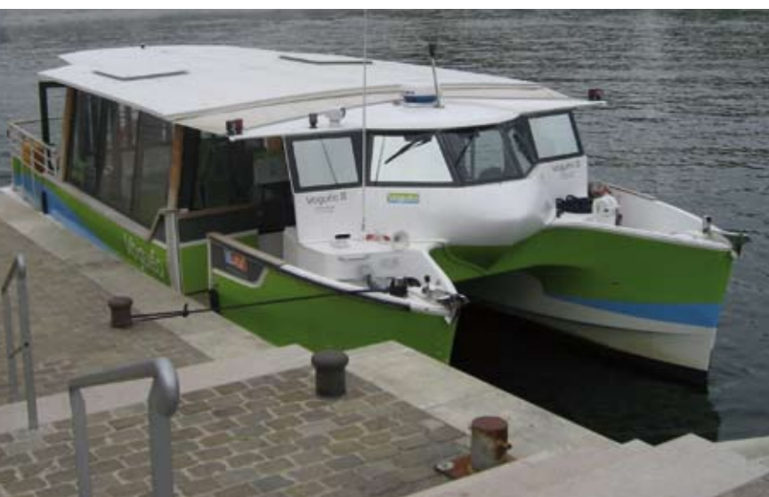
Kleine, snelle Ferry op de Seine in Parijs

Ze kozen als startpunt voor de gedachtevorming de Rijnkade en Waalkade, waar je komend vanuit respectievelijk de Liemers en de Ooij kunt aanmeren en weer kunt afvaren. "Dat is toch veel plezieriger en rustiger dan de dagelijkse worsteling door het verkeer?"